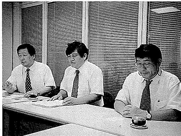
教員研修プログラム 株式会社マルコム

教員をベンチャー企業に派遣して研修をおこなうプログラム。教員は、知識として起業やベンチャービジネスが職業選択肢としてあることを知っているが、その実態を理解することは困難である。そこで、教員を3〜5日間程度ベンチャー企業に派遣して、体験を通して職業指導できる素地をつくることを目的としている。平成11年度は、夏休みを中心に教員6名を延べ22日間派遣した。平成12年度は10名の教員派遣を予定している。