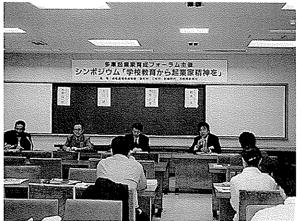
起業家教育シンポジウム

もあるが、強いリーダーシップは、ときに自分の意見や価値観の押しつけや多少乱暴な言葉使いになることもある。しかし、教育の現場では、言葉使いは丁寧であることを求めているし、価値観の違いは大切なことだが、押しつけは問題がある。義務教育では、家庭の環境に違いがあることを認識した授業も必要である。